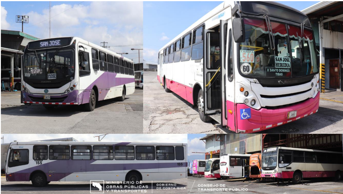
Buses de Santo Domingo por Tibás en plantel de la empresa.

17 de mayo de 2024 CTP-DE-PI-COM-0017-2024