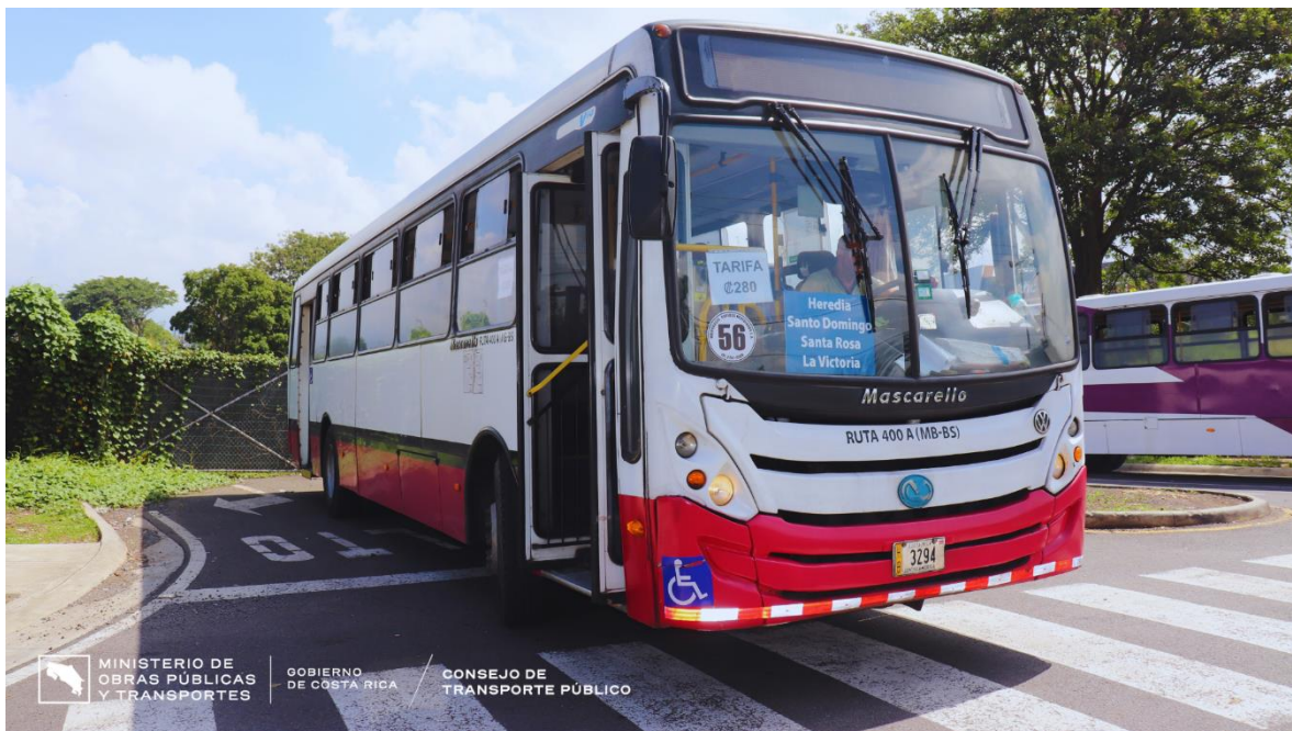
Bus de Santo Domingo–Santa Rosa– La Victoria iniciando su recorrido.

El Consejo de Transporte Público agradece a la comunidad por su paciencia y comprensión durante este periodo de transición. Estamos comprometidos con brindar un servicio de transporte seguro y eficiente que mejore la movilidad y calidad de vida de nuestros usuarios.